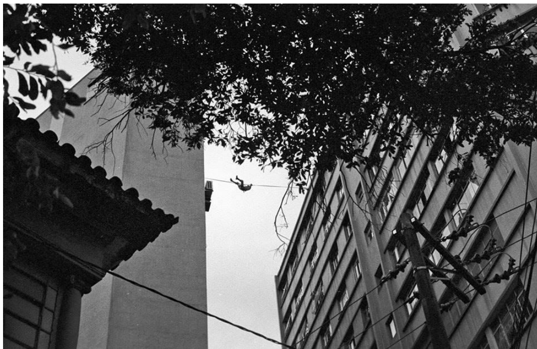
Figura 2: Encontrando equilibristas no treinamento de bombeiros na Cidade Alta, Vitória, 2014.

também possibilitem conexões que ajudem a ativar certa percepção, crítica e encantada, sobre o que se passa à nossa volta.