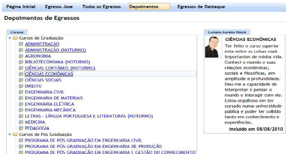
Figura 7 - Depoimentos dos egressos UFSC

Os depoimentos também ficam disponíveis para a administração da universidade e a sociedade em geral, conforme pode ser observado na Figura 7.