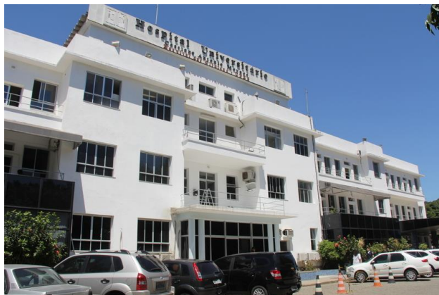
Figura 2 - UFES Campus Maruipe