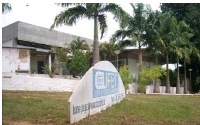
Figura 3 - UFES Campus Alegre (CCS)