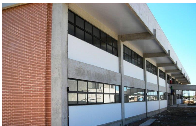
Figura 4 - UFES Campus São Mateus (CEUNES)