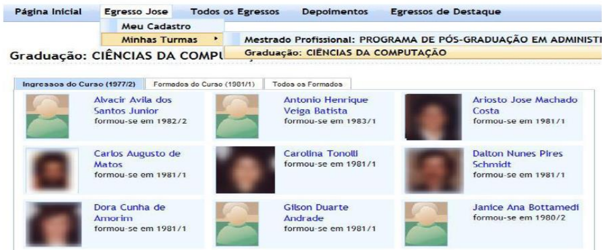
Figura 5 - Consultas aos egressos da UFSC por turma ou curso

curso de graduação ou pós-graduação, é possível também consultar a turma em andamento como pode ser observado na Figura 5, a seguir.