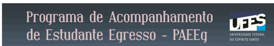
Figura 10 - Cabeçalho do questionário

A UFES está implementando o PROGRAMA DE ACOMPANHAMENTO DE ESTUDANTE EGRESSO, o PAEEg. Nós temos grande interesse em criar um canal de comunicação com você e saber, entre outras coisas, como se deu a sua entrada no mundo do trabalho, qual é a sua visão sobre a formação que recebeu na UFES e as suas opiniões para a melhoria da qualidade do Curso de graduação. Além disso, renovado nosso contato, poderemos divulgar eventos, oportunidades de colocação profissional, cursos e outras atividades que sejam de seu interesse. Para tanto, pedimos que você responda o questionário abaixo. Asseguramos que suas informações serão tratadas de maneira confidencial e somente serão usadas para avaliações e estudos institucionais.