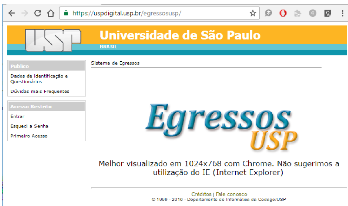
Figura 8 - Página principal do Portal de egressos USP