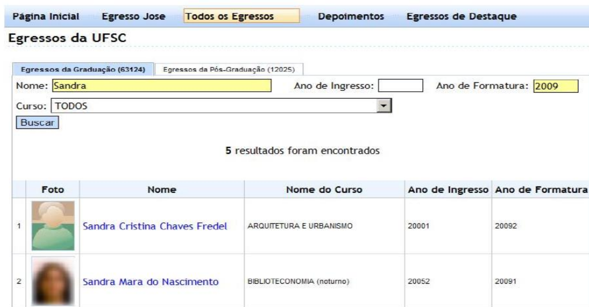
Figura 6 - Consulta pública de Egressos da UFSC