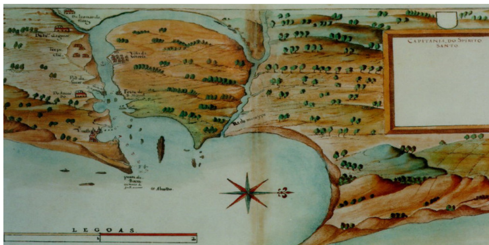
Mapa 1- Barra e Baía do Espírito Santo, com a Ilha de Vitória, de João Teixeira Albernaz. Arquivo: Biblioteca Itamaraty, Rio de Janeiro 25 .

O esforço empreendido na captura de escravos fugitivos ou aquilombados se dava de duas formas: a partir da iniciativa do senhor ou a partir da iniciativa do estado. Neste último caso, foi formado, com mais de cem homens, um corpo de infantaria, por ordem de Silva Pontes.