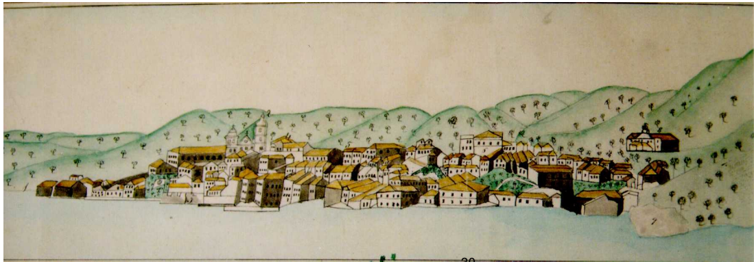
Gravura - Parte do Prospecto e Planta da Vila de Vitória 30 .

Vitória teve seu núcleo original estabelecido em 1535, em Vila Velha. Em 1551, é transferida, por motivos de segurança, para a ilha do Espírito Santo onde, por ordem de Vasco Fernandes Coutinho, foram construídas uma casa de fazenda e a igreja de Santa Luzia. A expansão da cidade se realiza muito lentamente, sendo a sua população, em 1722, de apenas 5.000 pessoas.