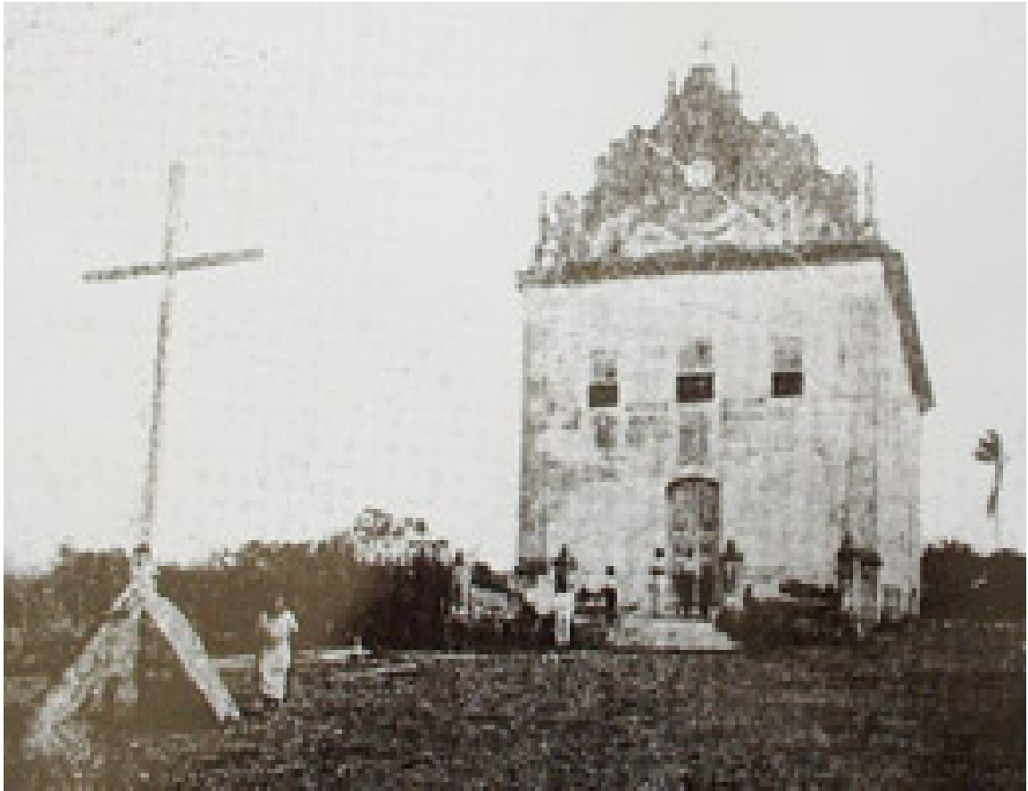
Igreja de São José do Queimado, em 1945.

Localizada às margens do rio Santa Maria, a freguesia de São José do Queimado, criada pela resolução nº 9 do dia 27 de julho de 1846, foi um importante entreposto comercial, e, à época da construção da Igreja, contava com uma população de cinco mil almas, sendo que, parte desta, era constituída por escravos.