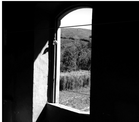
Janela lateral da casa de Afonso Cláudio - foto tirada em junho de 2007.

“Não me desvaneço de confessar a importância dos auxílios que recebi para escrever esta pequenina memória; sinto somente que não tivesse maiores esclarecimentos que suprissem o muito de deficiência e de vulgar que tem de atrair as atenções dos leitores complacentes, embora em proveito meu” (ROSA, 1999, p. 19).