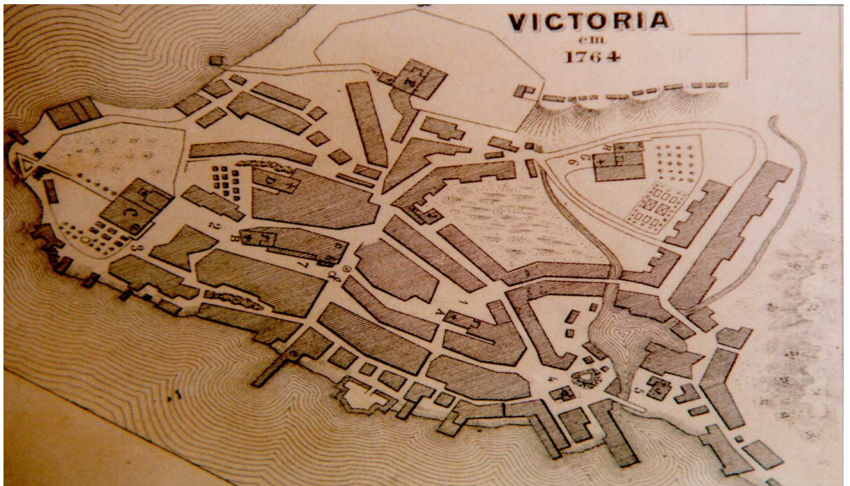
Planta da Vila de Vitória, em 1764.

Na capital Vitória havia 1.001 escravos, sendo 450 homens e 551 mulheres, para uma população de 3.360 livres em 1872. No conjunto das freguesias em torno de Vitória havia 2.716 escravos, sendo 1.393 homens e 1.323 mulheres, para uma população de 8.899 livres. Ou seja, tanto em Vitória como em seus arredores, tínhamos uma relação próxima de um para três entre escravos e livres (SOARES, 2006).