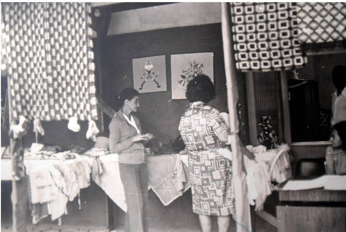
Figura 1: Bazar. Artesanato produzido por internos, 1970. (LOPES, Maria)

A galeria aqui montada conta com fotos do arquivo pessoal de Maria Lopes e com fotos encontradas nos arquivos do SAME – essas últimas datando de 1954. Deixemos que a história, agora, seja contada a partir de imagens.