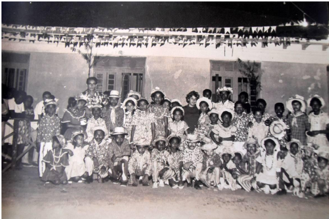
Figura 5. Festa Junina no Hospital Adauto Botelho, 1970. (LOPES, Maria)