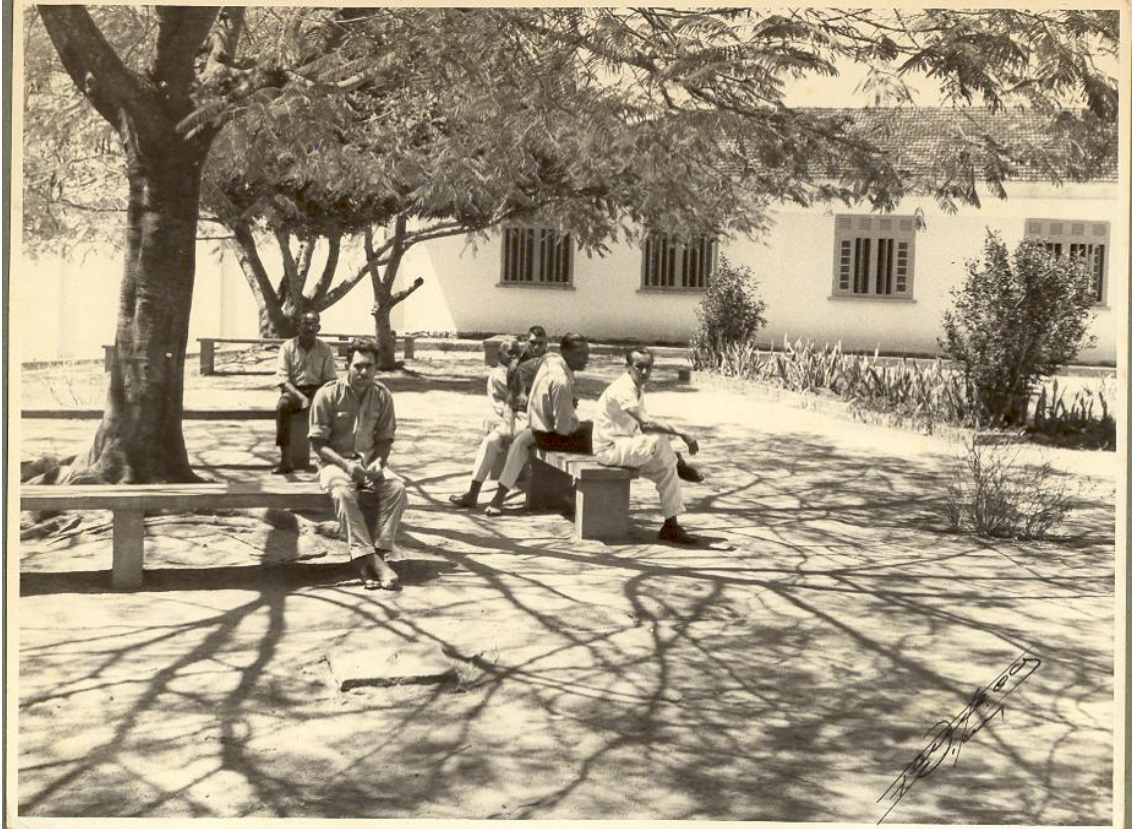
Figura 15. Homens internos no Hospital, 1954. (ESPÍRITO SANTO, 1997)