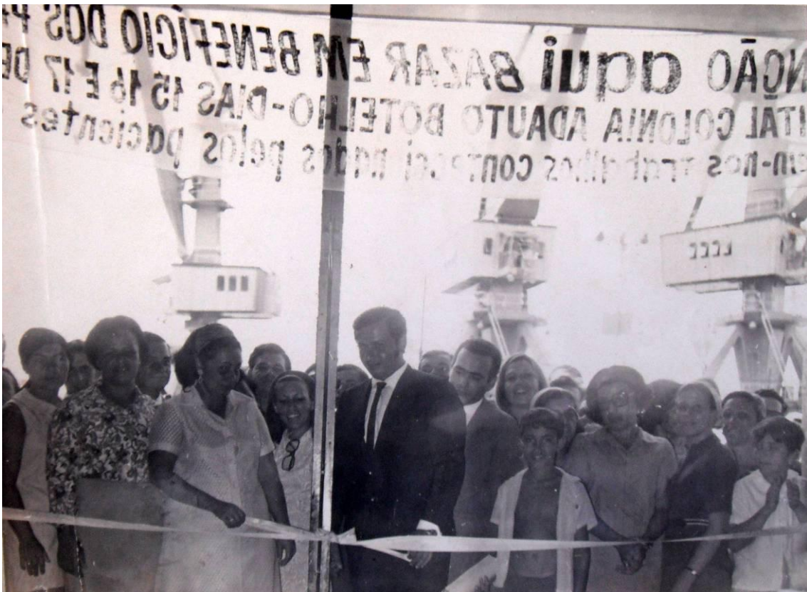
Figura 3. Feira de artesanatos produzidos pelos internos no Bazar, década de 1970. (LOPES, Maria)