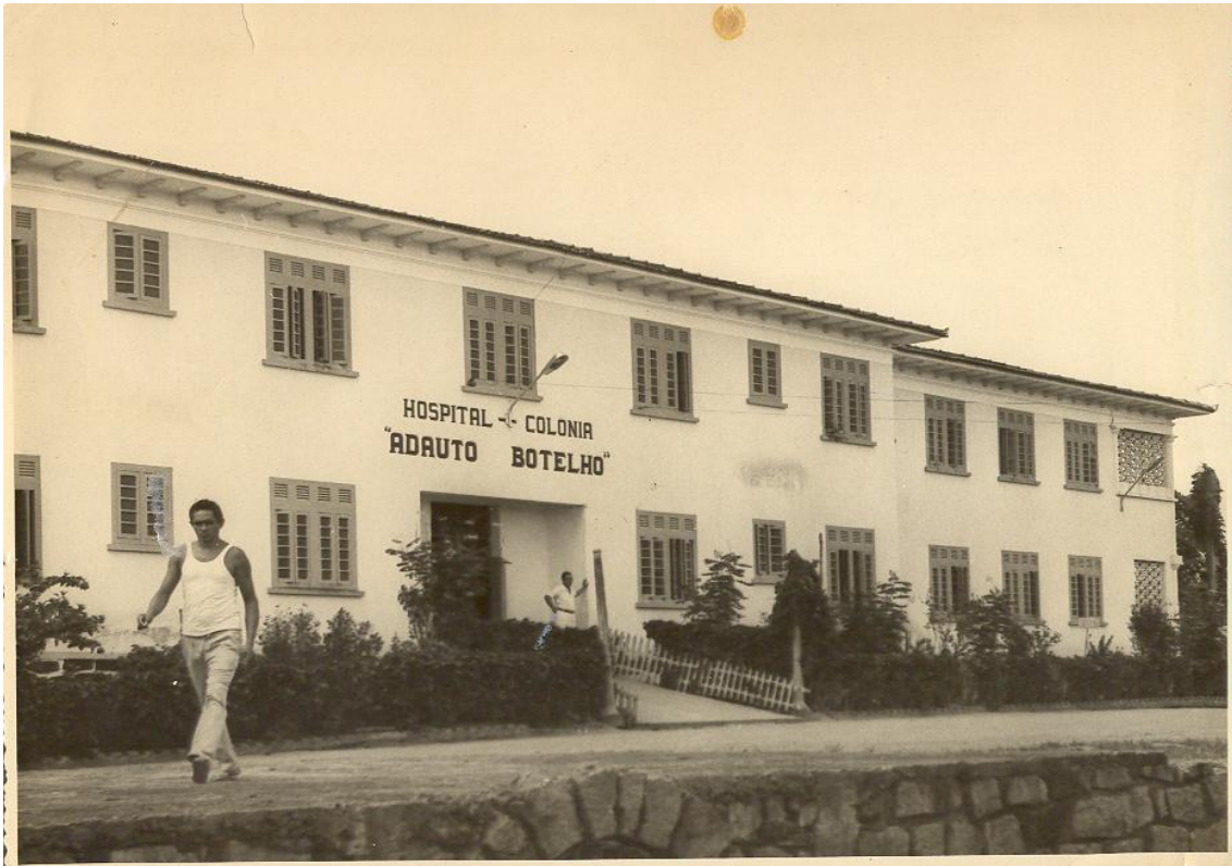
Figura 10. Hospital Colônia Aduato Botelho, 1954. (ESPÍRITO SANTO, 1997)