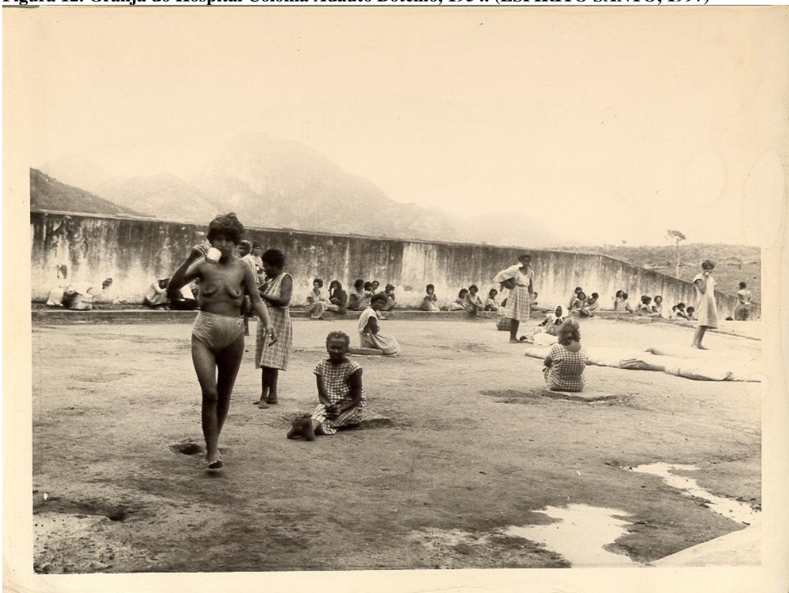
Figura 13. Internos no pátio do Hospital, 1954. (ESPÍRITO SANTO, 1997)