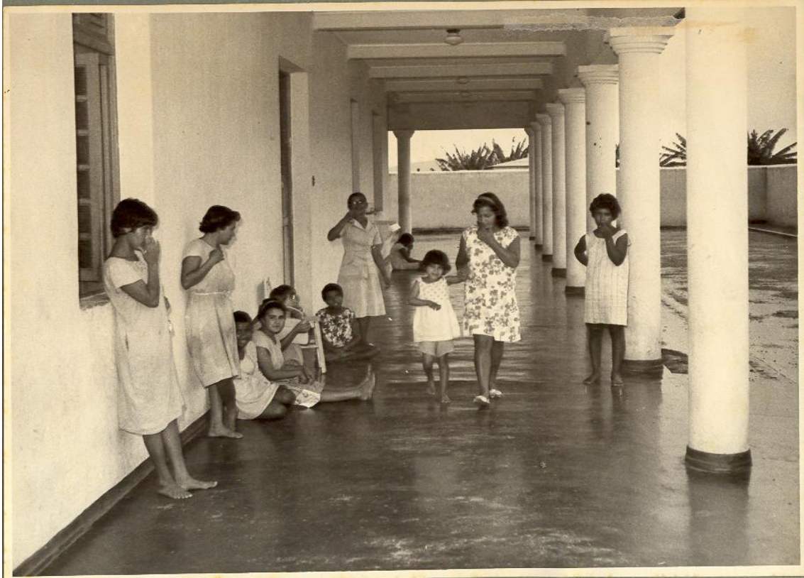
Figura 14. Mulheres internas no Hospital, 1954. (ESPÍRITO SANTO, 1997)