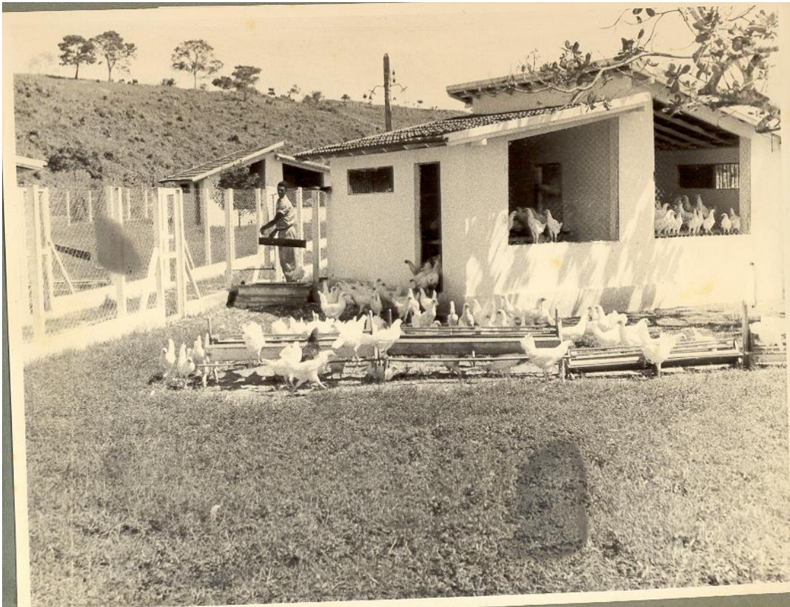
Figura 12. Granja do Hospital Colônia Adauto Botelho, 1954. (ESPÍRITO SANTO, 1997)