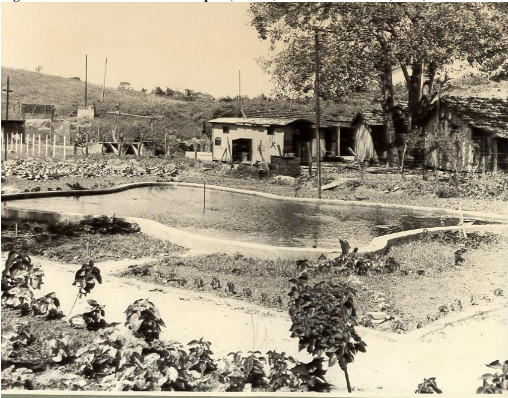
Figura 16. Lavoura do Hospital Aduato Botelho, 1954. (ESPÍRITO SANTO, 1997)