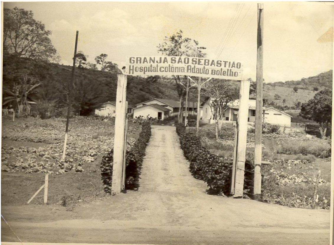
Figura 11. Granja São Sebastião: Hospital Colônia Aduato Botelho, 1954. (ESPÍRITO SANTO, 1997)