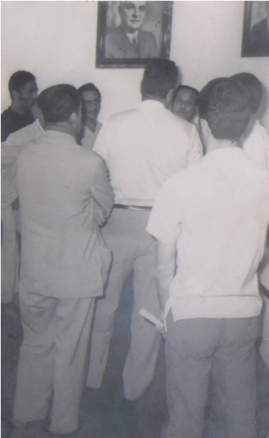
Figura 7. Refugiados da Ditadura Militar, 1970. (LOPES, Maria)