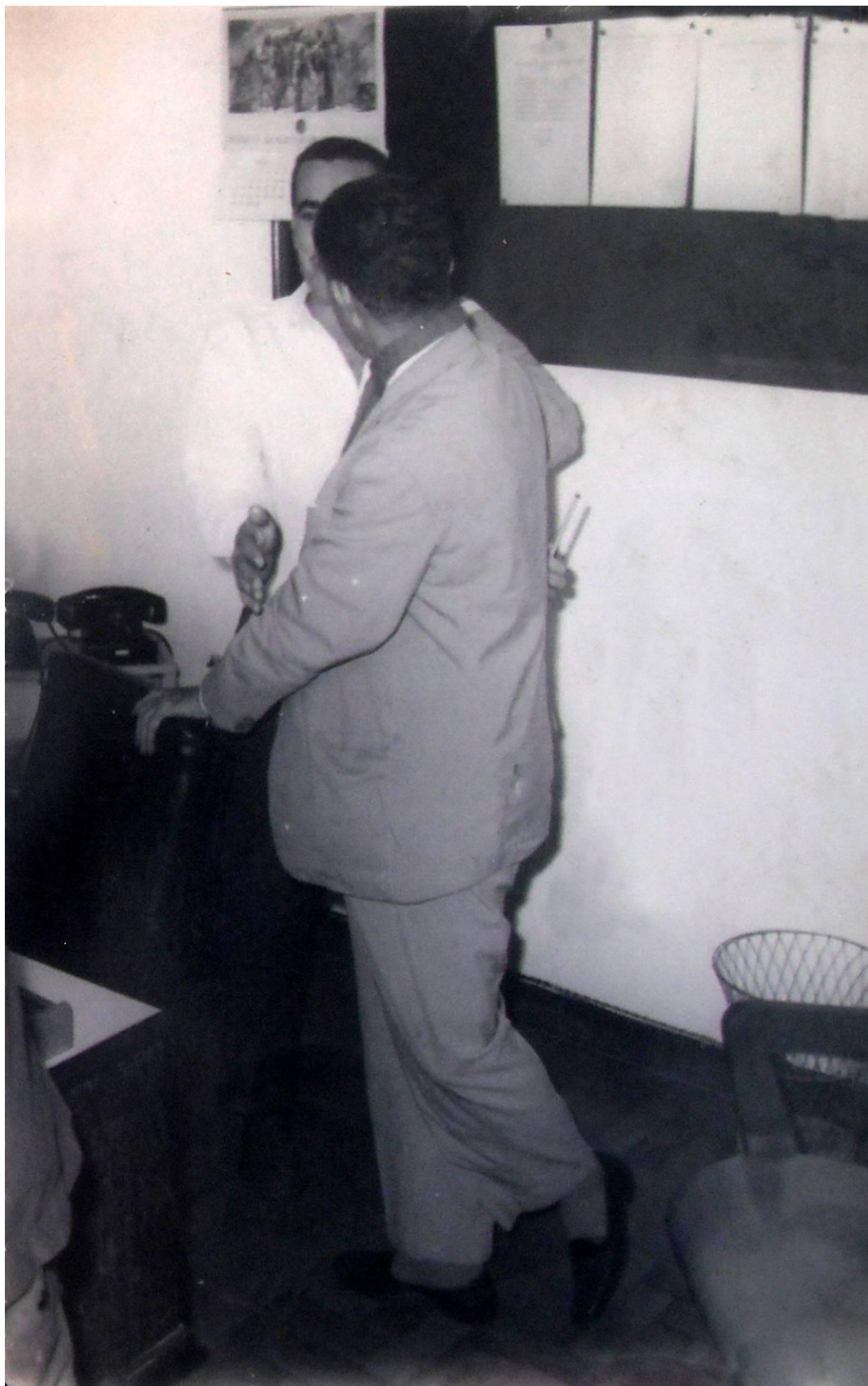
Figura 8. Jornalista refugiado da Ditadura Militar, década de 1970. (LOPES, Maria)