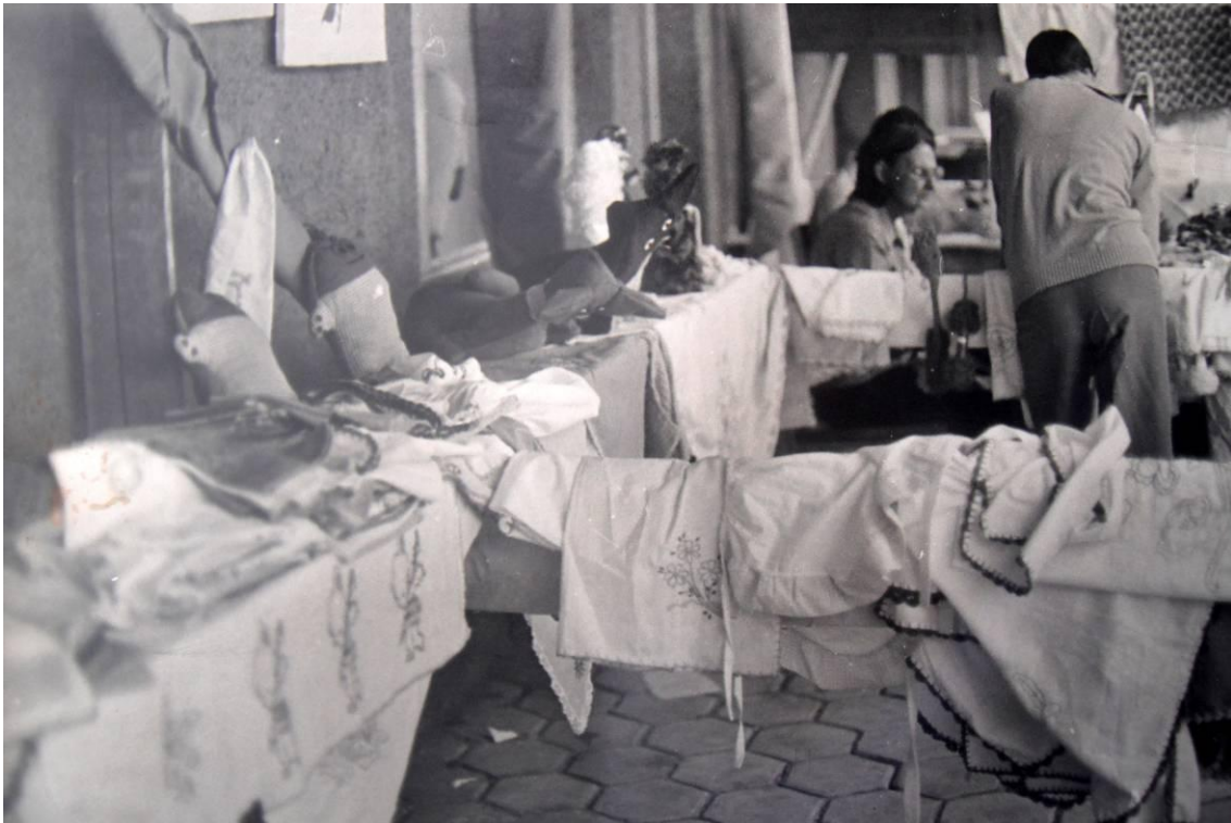
Figura 2: Bazar. Artesanato produzido por internos, 1970. (LOPES, Maria)