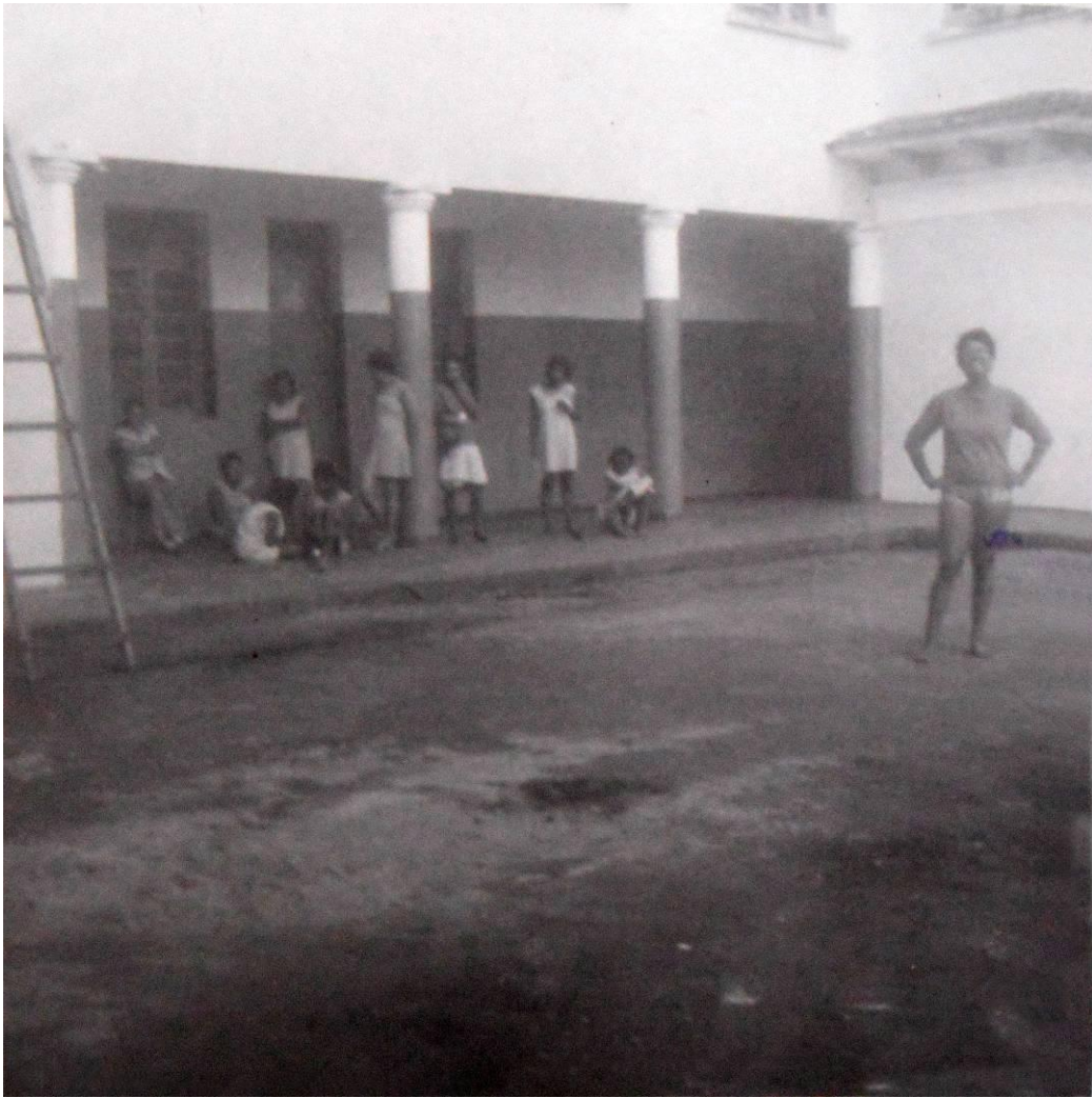
Figura 6. Pátio do Hospital, década de 1970. (LOPES, Maria)