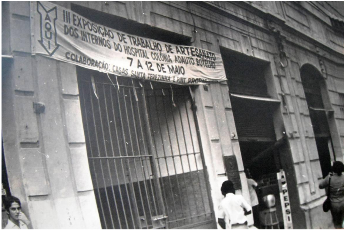
Figura 4. III Exposição de Artesanato dos Internos do Hospital Colônia Adauto Botelho, década de 1970. (LOPES, Maria)