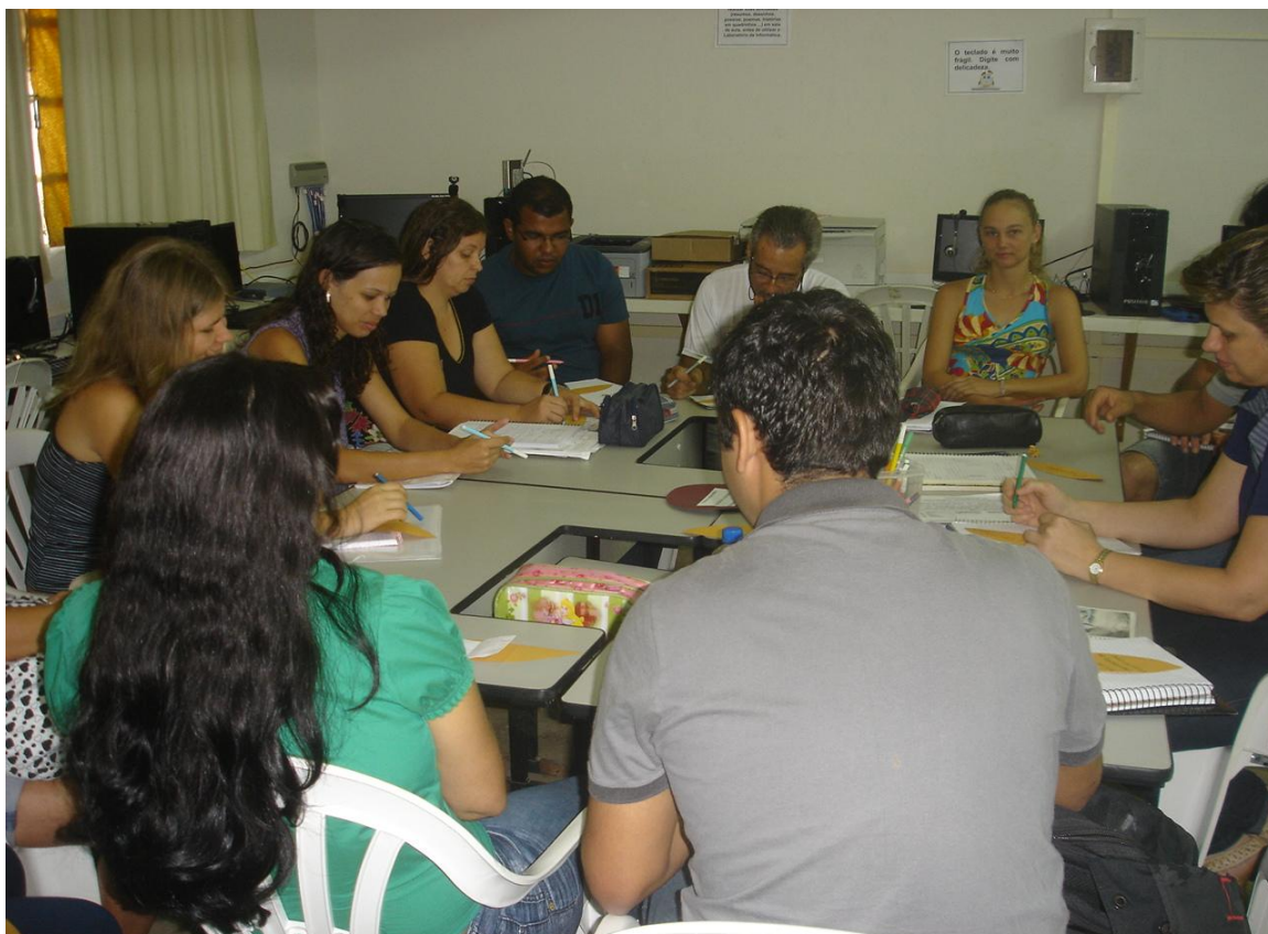
Momento de estudos continuados realizados semanalmente na EMCOR “Padre Fulgêncio do Menino Jesus” – Maio/2011 Colatina/ES