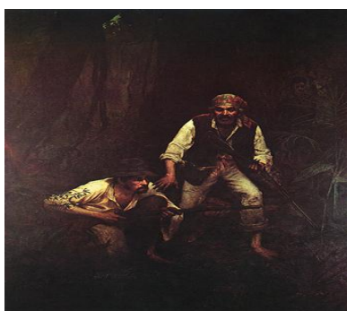
“Caipiras negaceando” (1888)