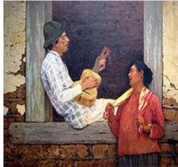
“O Violeiro” (1899)

As diferentes maneiras como o “caipira” 32 é apresentado no decorrer da história brasileira, em diversos meios de comunicação, não estão sendo postas em destaque nesse momento para que sejamos favoráveis ou contra um ou outro modelo representativo. O importante é que tenhamos ciência de que os pensamentos são datados, construções do/no tempo. No caso específico do “camponês” muitos deles reforçam o rótulo atribuído ao “homem do campo” a partir de uma visão de mundo simplista e simplificadora.