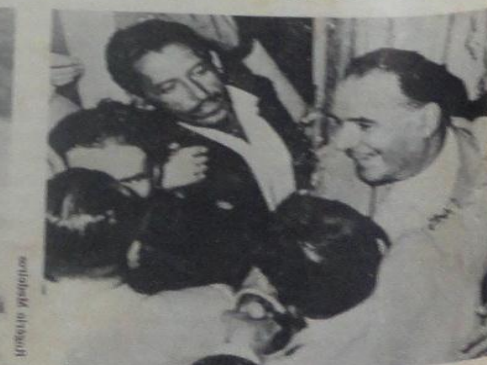
Na paz e na agitação