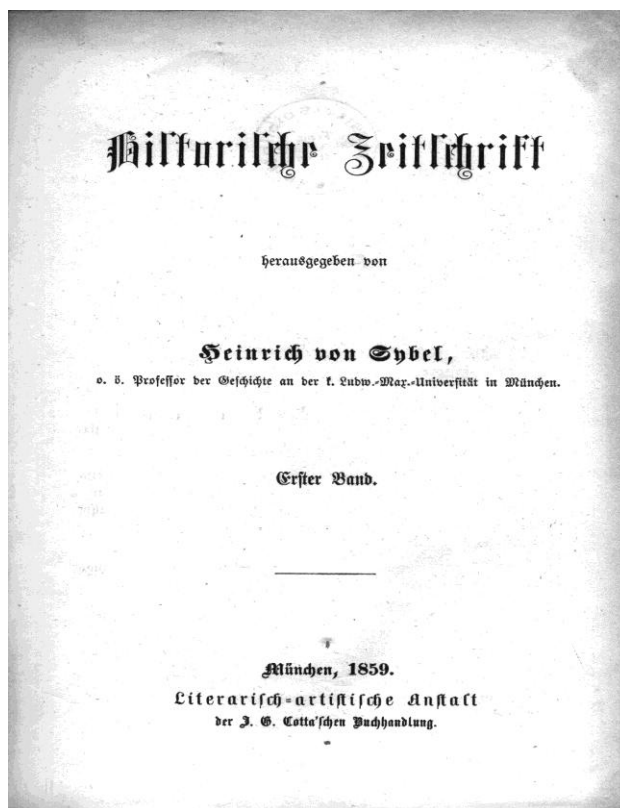
Figura 7 - Primeiro volume da Historische Zeitschrift publicado em 1859.

Essa ênfase referencial em sua sistematização científica é reveladora do caráter cada vez mais abertamente político do grupo de intelectuais em torno de Sybel e de sua revista histórica. Longe de representar um simples editorial histórico-científico o primeiro número da Historische Zeitschrift se caracterizava como o manifesto político daquele grupo de intelectuais defensores de um tipo de liberalismo moderado e marcadamente nacionalista. 346