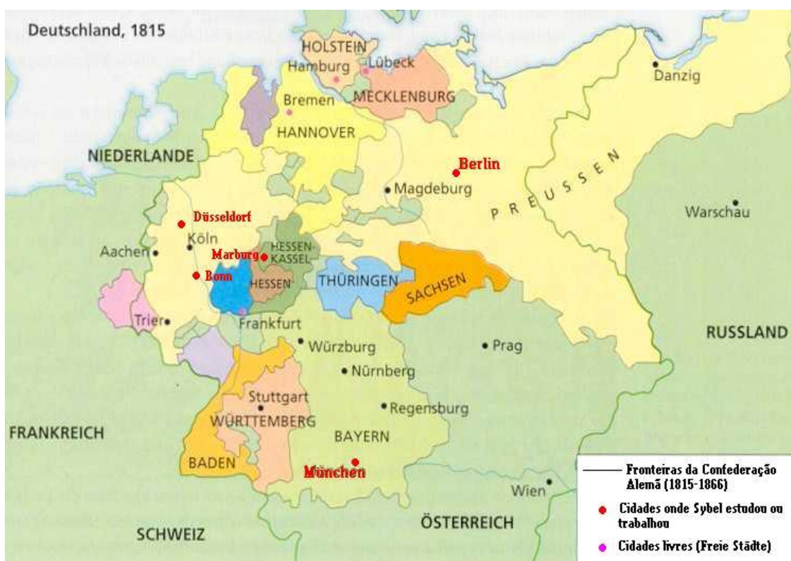
Figura 5 – Mapa da Confederação Alemã com destaque para as cidades onde Sybel estudou ou lecionou.

Com essas palavras, Mommsen resume em grande medida os dois aspectos que caracterizaram boa parte da carreira de Sybel: ímpeto e determinação, que no âmago da operação historiográfica assumiram a forma de um verdadeiro embate político, onde concepções idealistas aos poucos deram lugar às formulações pragmáticas características da intelectualidade alemã na segunda metade do século dezenove.