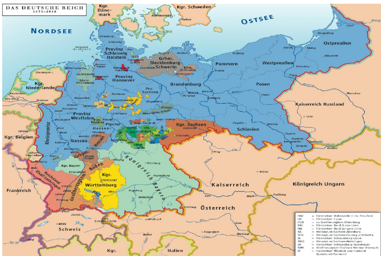
Figura 4 - As Fronteiras do Império Alemão em 1871.

“Fazendo as pazes” com Bismarck e o poder instituído, Sybel inaugurava uma nova fase de sua carreira acadêmica. A partir de então o trabalho do historiador adquiriria um caráter cada vez mais parcial, em conformidade com os anseios de Bismarck e do Estado nacional recém-fundado. Um tipo de historiografia alada ao poder oficial lograria o sucesso do intelectual em sua filiação como membro honorário da Preußische Akademie der Wissenschaften e sua condecoração em 1874 com a ordem do mérito prussiana para as artes e a cultura.