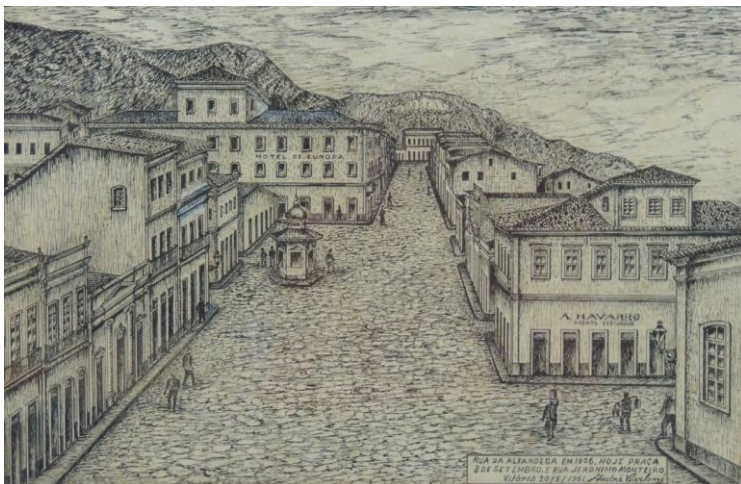
Figura 2: REPRESENTAÇÃO ARTÍSTICA DA PRAÇA DO CAIS GRANDE NO CENTRO DE VITÓRIA

Fonte: Gravura produzida em 20/05/1961 retratando a região em 1905. André Carloni. Quadro exposto na Sala de Coleções Especiais da Biblioteca Central da UFES.