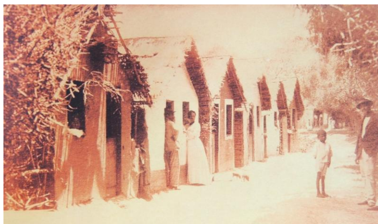
Figura 3: MORADIAS DE UMA COMUNIDADE NEGRA

Fonte: Rua Sete Mucambos. Cartão Postal. Fotografia de F. do Borge. Recife, PE, 1895. Coleção Particular de Aparecido Salatini. Apud. SCHUMAHER, Schuma; VITAL BRASIL, Érico. Mulheres negras do Brasil. Rio de Janeiro: SENAC Nacional, 2007, p. 87.