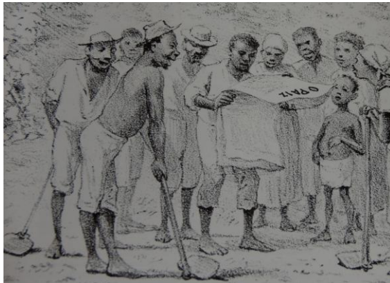
Figura 5: ILUSTRAÇÃO DE ESCRAVOS LENDO JORNAL E SE INFORMANDO SOBRE A ABOLIÇÃO

Fonte: Revista Ilustrada, 1887. Acervo Biblioteca José e Guita Mindim. Apud. SCHUMAHER, Schuma; VITAL BRASIL, Érico. Mulheres negras do Brasil, p. 101.