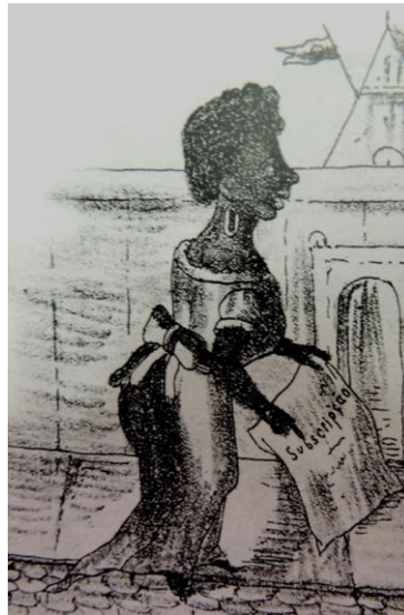
Figura 4: ESCRAVA ARRECADANDO DINHEIRO PARA A ALFORRIA

Fonte: Revista Ilustrada, 1871. Acervo do Instituto Arqueológico, Histórico e Geográfico Pernambucano. Apud. SCHUMACHER, Schuma; VITAL BRASIL, Érico. Mulheres negras do Brasil, p. 100.