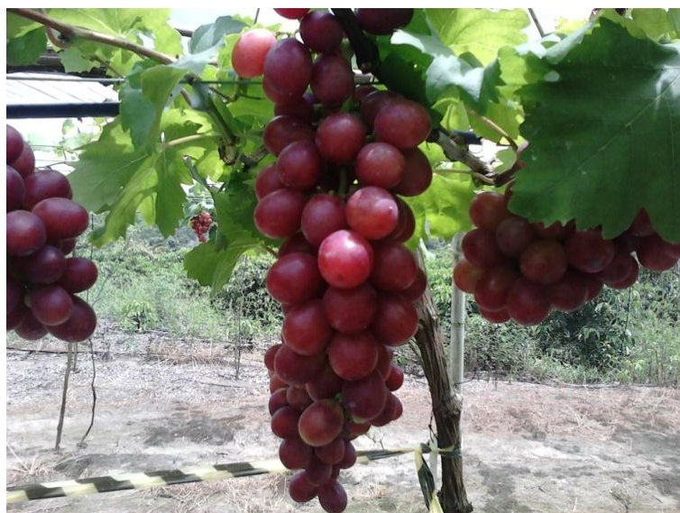
Figura 1. Uva cultivar Rubi.

É considerada uma variedade muito vigorosa, de ciclo longo (mais ou menos 150 dias no noroeste de São Paulo e mais ou menos 180 dias no sul de São Paulo), apresentando uma produtividade média de 30 t/ha. Possui pequena resistência à pragas e doenças. Necessita de poda longa (8 a 12 gemas). Os cachos têm a forma cilíndrico-cônica, são grandes (400 a 800 g), um tanto alongados e naturalmente muito compactos, necessitando de intenso desbaste. Apresentam boa resistência ao transporte e ao armazenamento, podendo ser conservados em câmaras frigoríficas. As bagas são grandes (8 a 12 g), ovaladas, textura trincante e sabor neutro levemente moscatel; para melhor intensidade do sabor, deve ser colhida com pelo menos 16 °Brix. A aderência ao pedicelo é boa, bem como a resistência ao rachamento (TERRA et al., 1998).