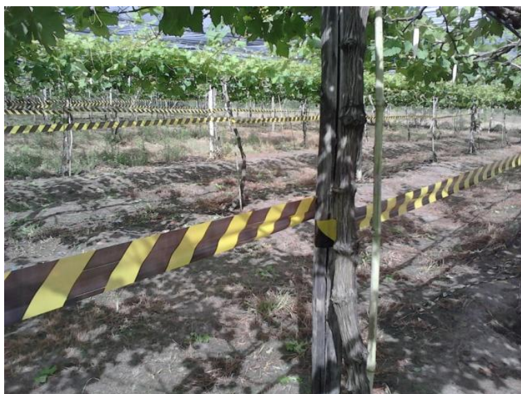
Figura 2. Demarcação das plantas selecionadas para o experimento.

O delineamento experimental utilizado foi em blocos casualizados com cinco tratamentos e quatro repetições. O trabalho foi desenvolvido durante um ano e meio (18 meses), com uma poda de inverno e duas podas de verão, totalizando três safras (colheitas), porém, os dados foram avaliados somente na terceira (última) safra, pois foi a que mais sofreu influência dos tratamentos. As vinte plantas do experimento foram selecionadas e demarcadas na área do plantio (Figura 2) para evitar que pessoas não autorizadas viessem a alterar o experimento com alguns tratamentos culturais diferentes do que estava sendo utilizado.