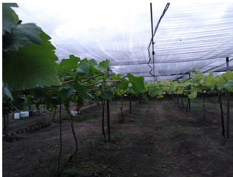
Figura 5. Diferença do teor de clorofila nas folhas da uva cv. Rubi, dias após receber os tratamentos.