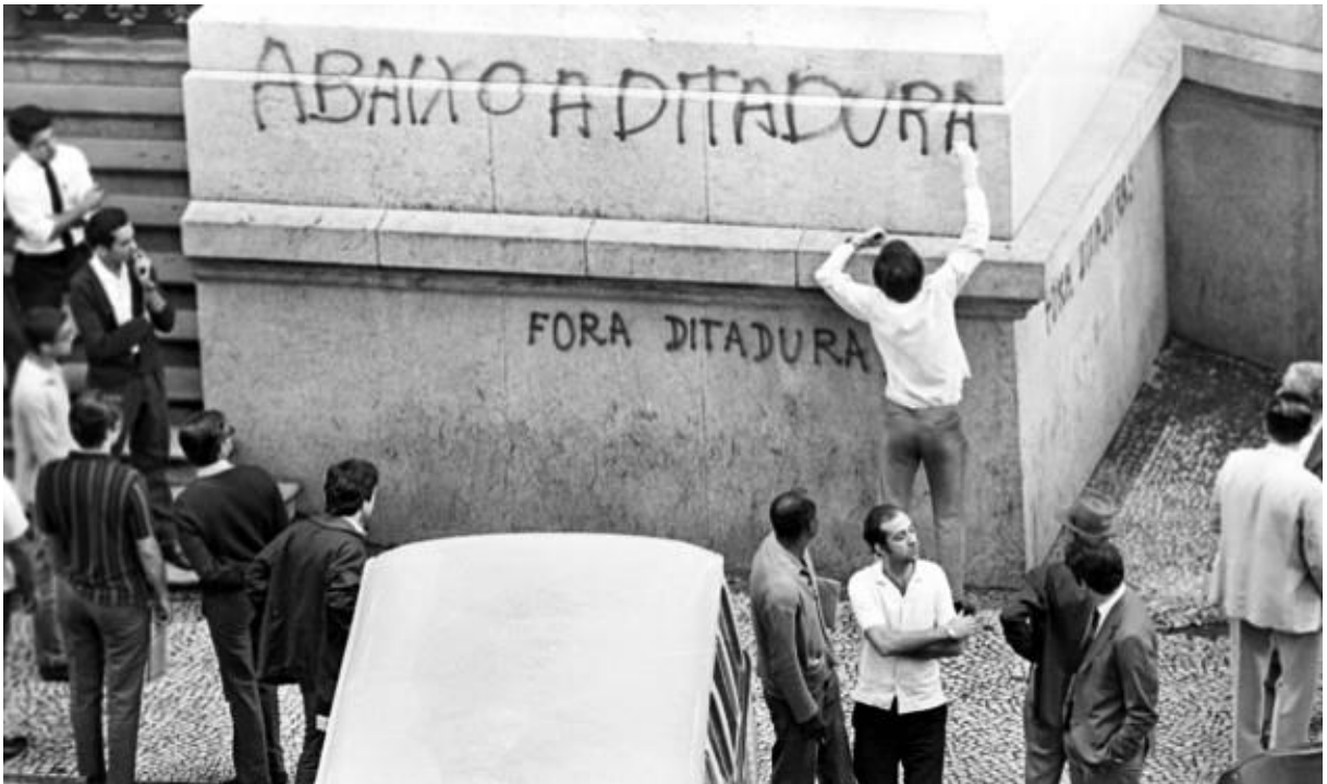
Figura 17 - Jovem picha fachada do Teatro Municipal do Rio de Janeiro, em protesto, durante a Passeata dos Cem Mil. 29 de Junho de 1968.

Quanto aos vocabulários, vemos a Figura 17, que ficou imortalizada como uma das principais memórias da resistência a Ditadura Militar. O termo, “Abaixo a Ditadura”, que se tornou praticamente a principal palavra de ordem também do movimento estudantil e dos pichadores em Vitória, como vimos nas Figura 11, Figura 12 e Figura 13, com a reprodução do mesmo termo.