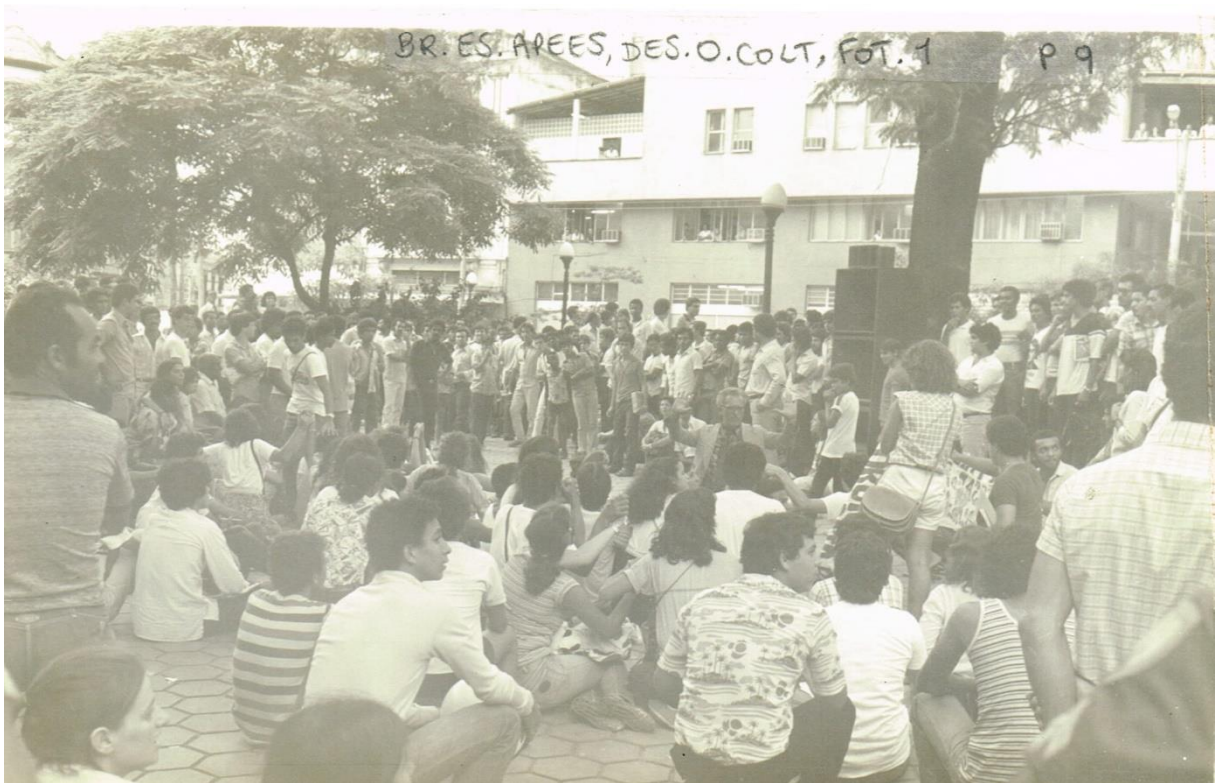
Figura 22 - Dossiê 01 – Público do ato em forma circular, com espaço vazio ao centro. Algumas pessoas estão sentadas e outra parte de pé. 06/01/1981. Praça Costa Pereira.

A Figura 22, logo acima, é importante para a alegação contrária aos estudantes presentes, pois junto a ela o dossiê possui a inscrição que durante esse registro se cantava o hino nacional. A DOPS/ES em seus registros fotográficos buscava encontrar aquilo que pudesse subverter a ordem e o respeito, neste caso aos símbolos nacionais, que foram supervalorizados durante todo o regime militar. A Lei Nº 5.700 de 1º de setembro de 1971, instituída por Emílio Médice, define os símbolos nacionais oficiais e suas regras como conhecemos, como: Bandeira; Hino Nacional; Armas Nacionais; Selo Nacional; e as cores oficiais do Brasil.