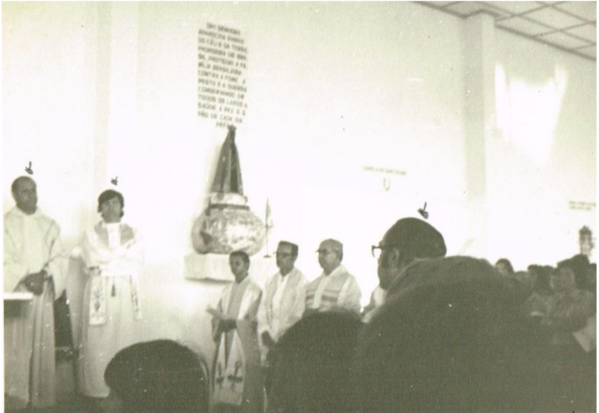
Figura 2 - Dossiê03 - Celebração Nossa Senhora Aparecida - Retiro Anual do Clero. Sem local informado. 1976. Destaque para as setas de caneta.

- Estrutura: Fotografias espaciais identificando os limites geográficos dos eventos, quantidade de pessoas, tamanho do evento e retratação dos acontecimentos ocorridos de maneira geral (Figura 3).