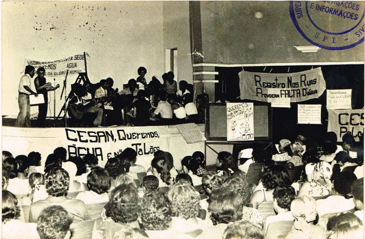
Figura 4 - Dossiê 26 - Fotografias relacionadas a movimentos sociais. Sem local. Sem data. Destaque para o carimbo do SPI.

Já falamos sobre a observação das funções sógnicas nas imagem da DOPS/ES, percebemos a fotografia como uma escolha efetuada em um conjunto de então possíveis escolhas. Quanto à terceira relação, proposta por Ana Maria Maud, a respeito da consideração dos elementos da fotografia com o contexto, remetendo-se a questões técnicas da materialização do documento, exploraremos agora: