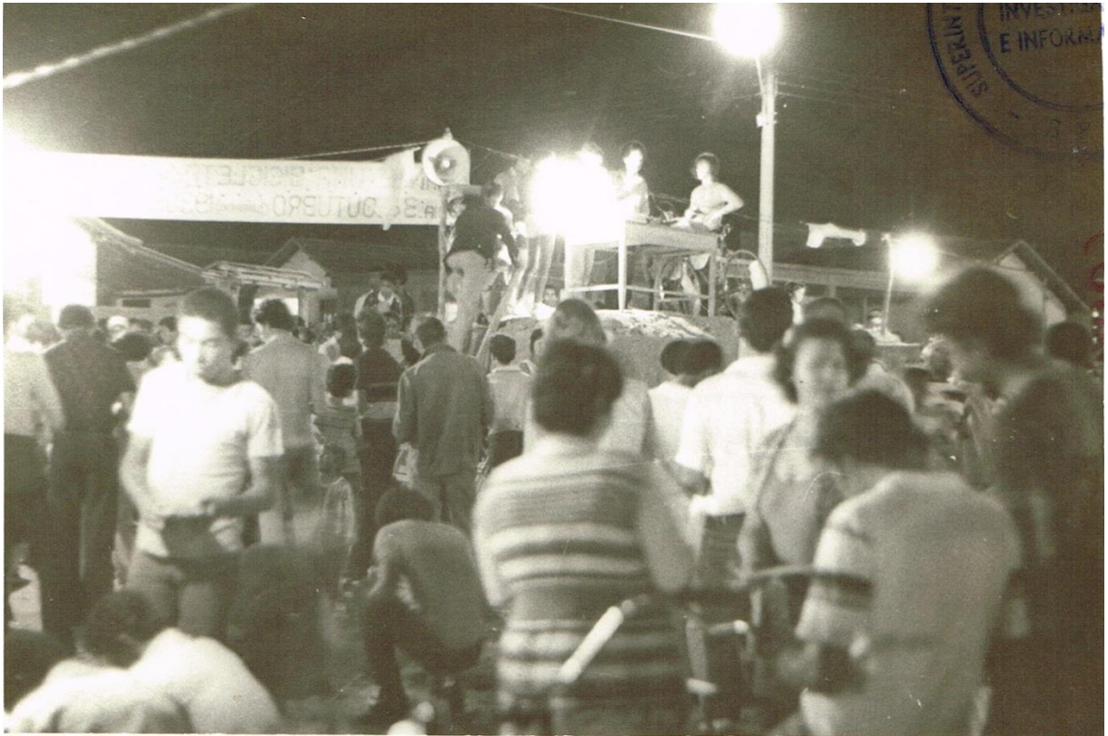
Figura 6 - Dossiê 22 - Foto de costas de multidão. Um palanque com cinco pessoas, uma delas segura uma bicicleta. 03/10/1981. Praça Hélio Ferraz, Serra-ES.