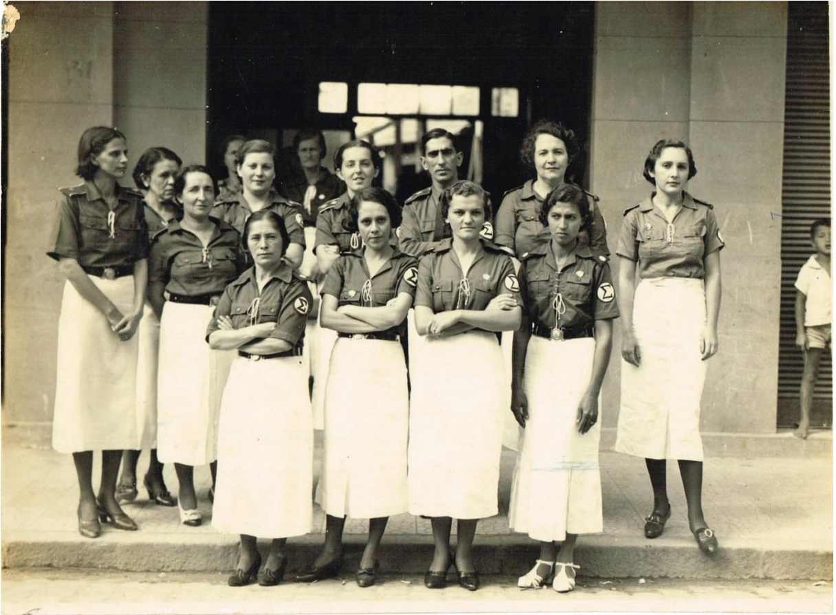
Figura 5 - Dossiê 12 - Grupo de treze mulheres e um homem posa uniformizados com o Sigma Integralista, em frente a um edifício. 1934 – 1937. Sem local definido.

- Fotografias Diletantes: Este tipo de fotografia não pode ser considerado um registro amador, mas, também, não se encontra em perfeitas condições técnicas com foco, luz, distância, etc. São muitas vezes realizadas em movimento, não se sabe se isso se dá pela falta de experiência do fotógrafo, ou por ele se encontrar em um momento em que deveria ser rápido e cuidadoso, justamente pelo fato de agentes da DOPS não serem bem vindos em eventos dos militantes de oposição ao Regime Militar, a exemplo das Figura 6 e Figura 7.