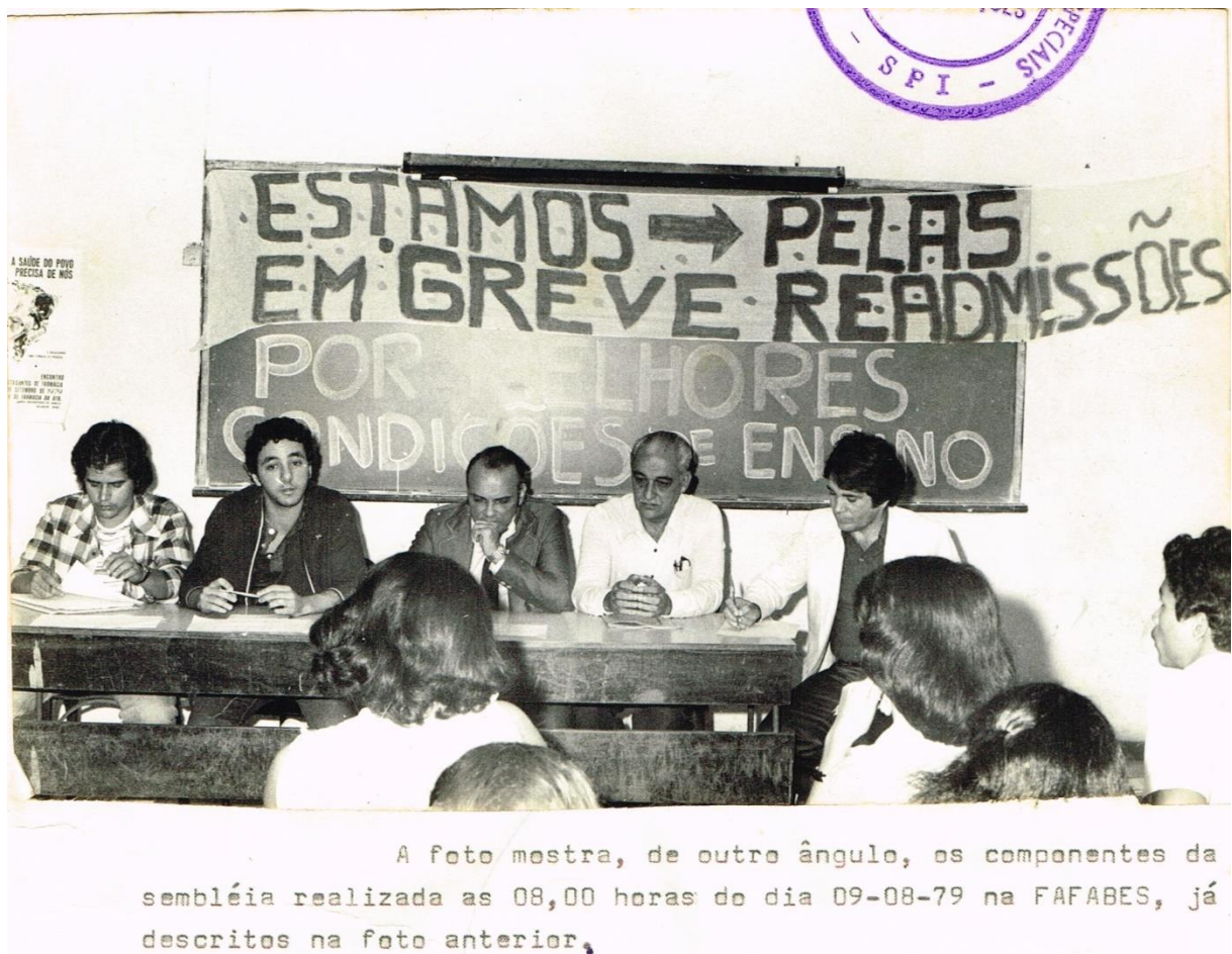
Figura 18 - Dossiê 24 – Público e cinco pessoas compondo uma mesa à frente, todas as cinco identificadas com números. Ao fundo as faixas “Estamos em Greve – Pelas readmissões” e “Por melhores condições de ensino”. 09/08/1979. Santa Casa de Misericórdia.

A Figura 18 é o nosso primeiro registro fotográfico sobre o movimento estudantil no Espírito Santo após o AI-5; da Faculdade de Farmácia e Bioquímica do Espírito Santo (FAFABES), que não havia sido incorporada a UES/UFES em 1961.