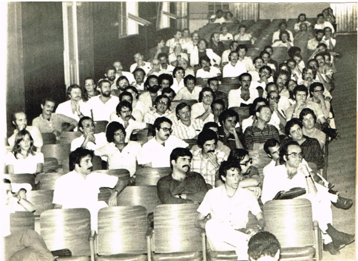
Figura 23 - Dossiê 28 - Assembleia Geral dos Médicos do Espírito Santo. 03/09/1979. Colégio do Carmo.

A documentação da DOPS/ES é muito rica, em especial a fotográfica, e apesar desse trabalho apenas seguir o contexto do movimento estudantil, ela permite novas abordagens, como compreender o perfil da sociedade capixaba no período da ditadura militar, no caso os Sindicatos dos Médicos (Figura ) e o Sindicato dos Professores (Figura 2). Através das imagens da DOPS/ES é facilmente possível afirmar que, durante a segunda metade do Século XX no Espírito Santo a classe médica era composta majoritariamente por homens e a de professores quase que exclusivamente por mulheres.