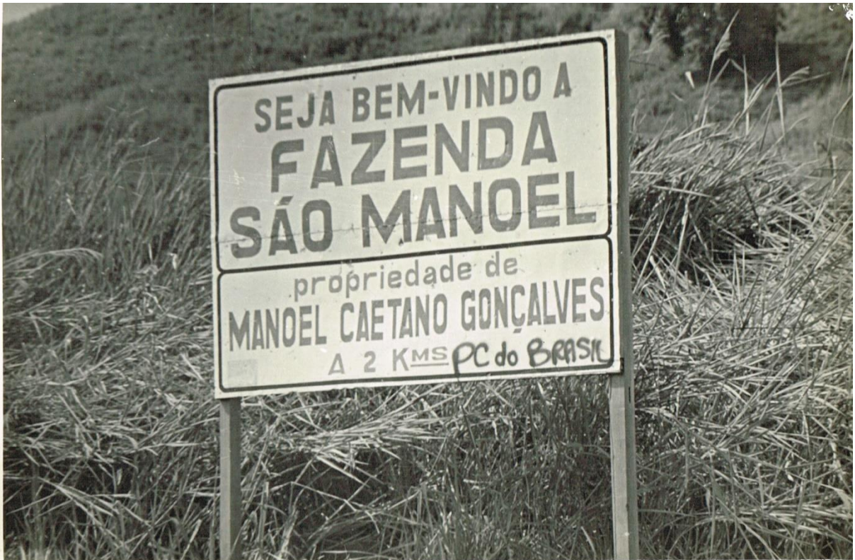
Figura 15 -Dossiê 06 – Pichação “PC do Brasil” em placa “Seja bem vindo à fazenda São Manoel – propriedade de Manoel Caetano Gonçalves – a 2kms”. Sem data. Espírito Santo.

Não existem informações sobre onde seria essa Fazenda São Manoel, informações do proprietário e/ou se possui alguma relação direta com o PC do B ou se a pichação foi apenas um acaso. Mas é claramente possível ver que se trata de uma placa afixada em uma região com mato, o que indica que não seria em um contexto urbano. Diferente é na Figura 15, que já se percebe um contexto mais urbano, provavelmente residencial. As fotos do dossiê sobre as pichações do PC do B não possuem data e nem informações escritas mais precisas que nos auxiliem a melhor situar as imagens, muita vezes também eram realizadas durante os atos estudantis.