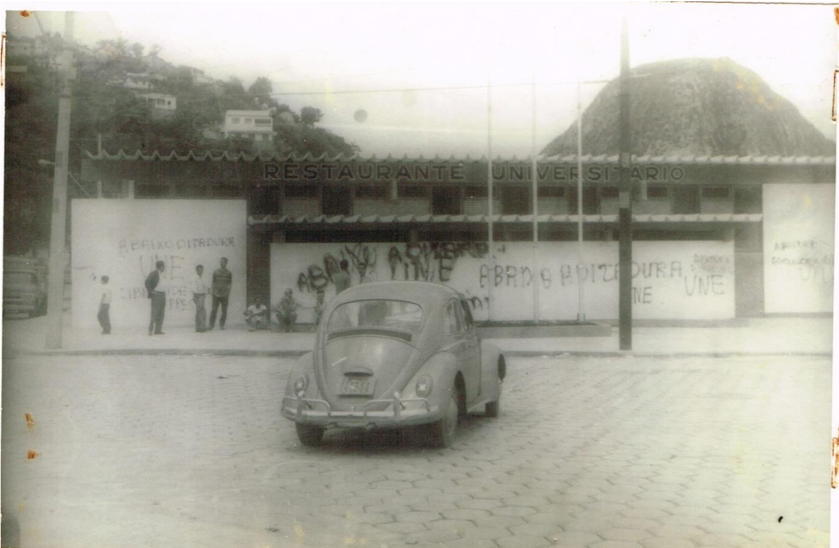
Figura 13 - Dossiê 19 – Restaurante Universitário com um fusca estacionado na frente com diversas pichações na parede “UNE” e “Abaixo a ditadura”. 18 de Outubro de 1968. Centro de Vitória.

Podemos ver que novamente o Restaurante Universitário da UFES se torna palco de manifestações do movimento estudantil. A DOPS/ES se preocupa em mostrar uma sequência de fotografias que ilustram o crime de depredação a bens públicos e privados e principalmente com destaque ao conteúdo das grafias. Os dois eventos estão claramente ligados à prisão dos estudantes em São Paulo e à onda de protestos e pichações pela cidade de Vitória com dizeres citando a UNE e os militares. No dia 18 de outubro a DOPS/ES também registrou uma paralização dos estudantes de engenharia da UFES.