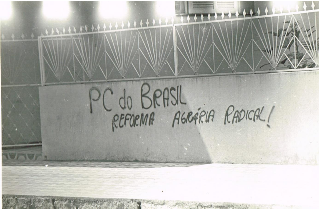
Figura 16 - Dossiê 06 – Pichação “PC do Brasil – Reforma agrária radical!” em muro com grades. Sem data. Espírito Santo.

A pichação/graffiti encontra-se atualmente entre duas visões: uma denomina como um ato de vandalismo ou um atentado ao patrimônio, e a outra, que o defendem como uma expressão de arte alternativa, como uma contracultura, em que se manifesta a criatividade, estimulada por vezes, pela crítica à realidade social ou, simplesmente, pela vontade de comunicar usando os espaços urbanos.