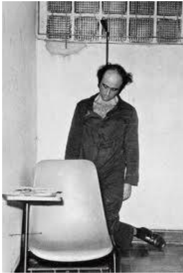
Figura 14 - Vladimir Herzog suicídio. 28 de Outubro de 1975. DOI-CODI de São Paulo.

Apesar da fotografia de Vladimir Herzog ser considerada “encenada e mentirosa”, a imagem não perde seu contexto indiciário, de fato houve a morte, isso não é questionado. Sua verdade está no fato que o regime militar matou muitos em seus “porões” travestidos de cenas de suicídio.