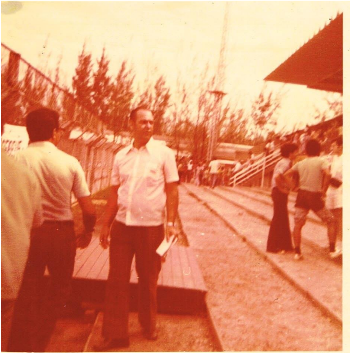
Figura 7 - Dossiê 7 - Homem de camisa branca caminhando em meio à multidão. 09/02/1975. Campo do Desportiva, Cariacica-ES.

Até este ponto da pesquisa, procuramos destacar a formação da estrutura informacional do Regime Militar, bem como a criação e operação da DOPS no Espírito Santo. Além disso, abordamos as prerrogativas do uso da imagem como fonte histórica e as perspectivas de estudos através dos signos e da representação de cultura política impressa e os tipos de frentes de atuação da DOPS/ES. No próximo capítulo, pretende-se explorar, através das análises dos Discursos Institucionais das fotografias da DOPS/ES, a identificação de possíveis signos deixados impressos para entendimento da Cultura Política do Movimento Estudantil dos considerados subversivos como do modus operandi dessa instituição de vigilância.