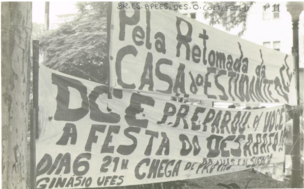
Figura 21 – Dossiê 01 – Fotografia de duas faixas penduradas: “Pela retomada da Casa do Estudante – DCE” e “DCE preparou para você a Festa do Desabafo!!! Dia 6 – 21h – Ginásio da UFES – Chega de provas e de sufoco”. 06/01/1981.

As imagens do dossiê “Ato Público pela tomada da Casa do Estudante” constituem o material fotográfico mais recente disponível. Datado de 1981, não há mais nenhuma fotografia no Fundo da DOPS do Espírito Santo posterior. Com o total de 42 fotografias, a polícia política se ocupou em registrar apenas os momentos pacíficos do ato estudantil, os momentos de “praça de guerra” narrados pela Comissão da Verdade da UFES não possuem registros em imagens, o que de certa forma comprava que a DOPS não produziria provas contra o regime militar, que nesse momento já estava em deterioração.