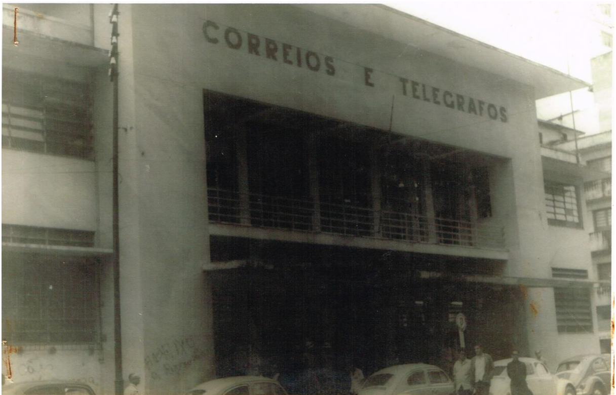
Figura 12 - Dossiê 19 – Prédio com a inscrição “Correios e Telégrafos” e em uma das colunas a pichação “Abaixo a repressão”. 18 de Outubro de 1968. Centro de Vitória.