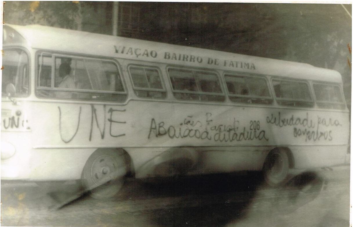
Figura 11 - Dossiê 19 – Ônibus da Viação Imperial pichado com as seguintes: “UNE”, “Cães racistas”, “Liberdade para os presos”, “Abaixo a ditadura” e “Nós somos a UNE”. 18 de Outubro de 1968. Sem local.