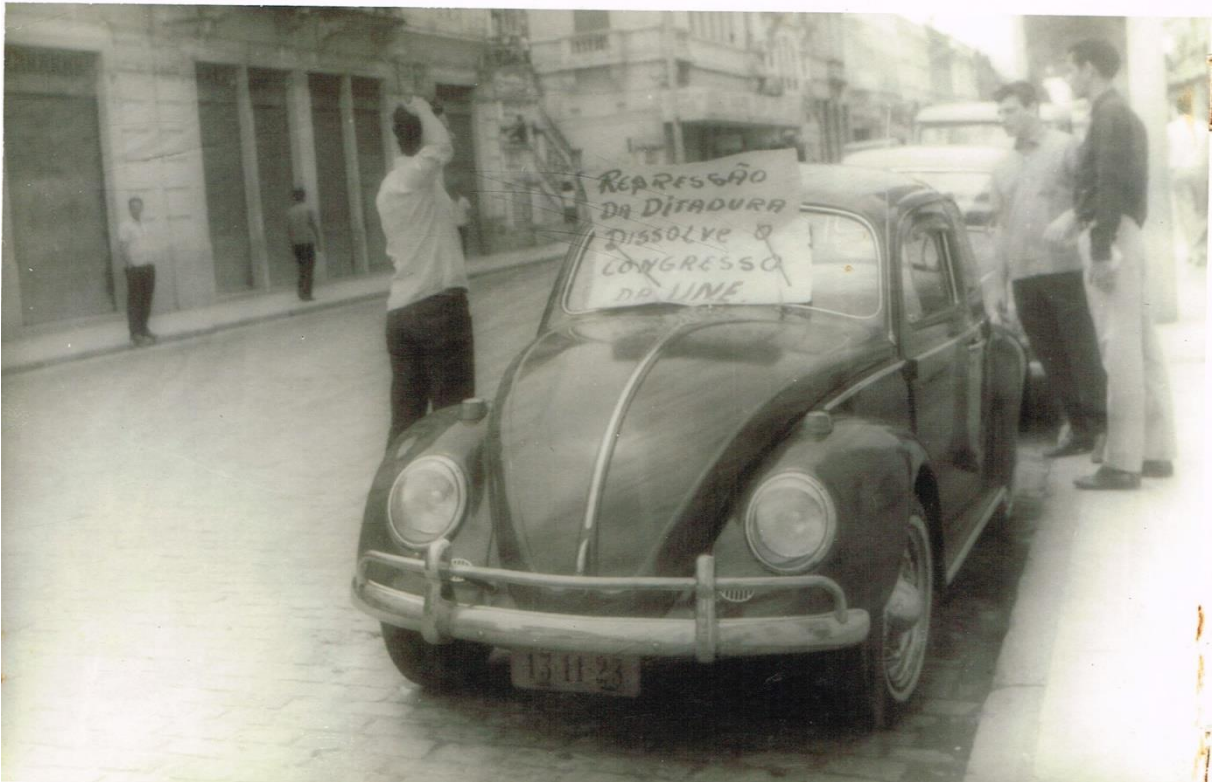
Figura 10 - Dossiê 19 – Fusca estacionando com um cartaz preso no para-brisa “Repressão da Ditadura dissolve Congresso da UNE”. Pessoas paradas na calçada próximo ao carro e outras caminhando. 18 de Outubro de 1968. Sem local.