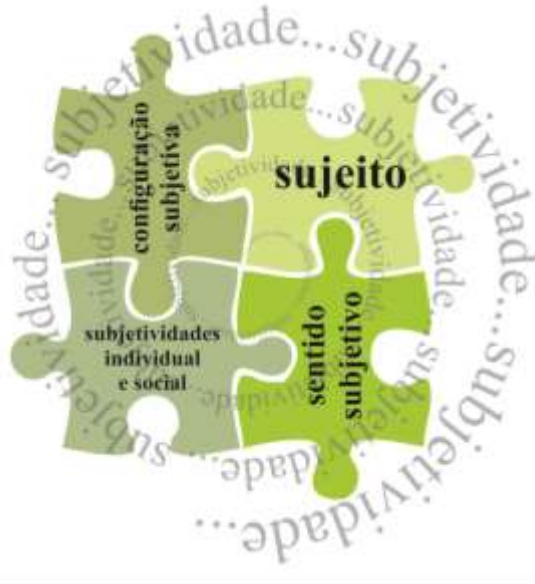
Figura 1— Esquema simplificado das categorias propostas por González Rey (2005b) para o entendimento do macroconceito de subjetividade

subjetividade, e não como forma de fragmentá-la, haja vista que estão intrinsecamente relacionadas (Figura 1).